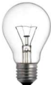
Figura 2: Lâmpada incandescente. Figura 3: Lâmpada halógena.

O conforto luminoso refere-se à qualidade da resposta do usuário em relação às condições propiciadas pelo ambiente na sua adaptação, ou seja, quanto melhor forem as condições ambientais, menor será o esforço para o indivíduo se adaptar e promover suas atividades com melhor qualidade. Os tipos de lâmpadas mais indicadas que são as incandescentes (figura 02), halógenas (figura 03) e de LED (figura 04), e devem ser evitadas lâmpadas fluorescentes tubulares, pois elas podem piscar e emitir sons que incomodam as crianças com hipersensibilidade auditiva. Quando possível, pode ser utilizado um Sistema Óptico de Fibras, o qual consiste em um feixe de fibras ópticas com luzes e cores diversas, conectadas em cascata. Esse equipamento oferece conforto, relaxamento e total interação com o usuário, estimulando o sistema sensorial visual e tátil (LAUREANO, 2017).